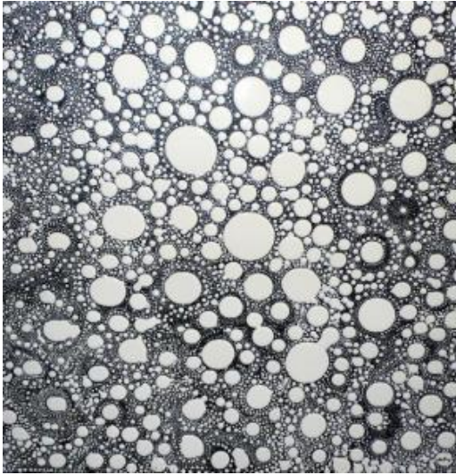
« L'hiver » de Fleur BAUDON

Des artistes aussi ont joué avec des ronds :