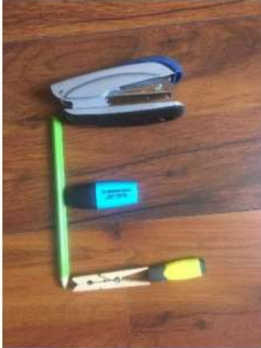
Le E de EMMA