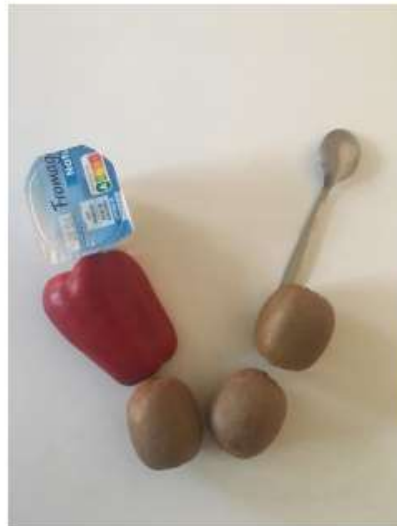
LE V de VERONIQUE