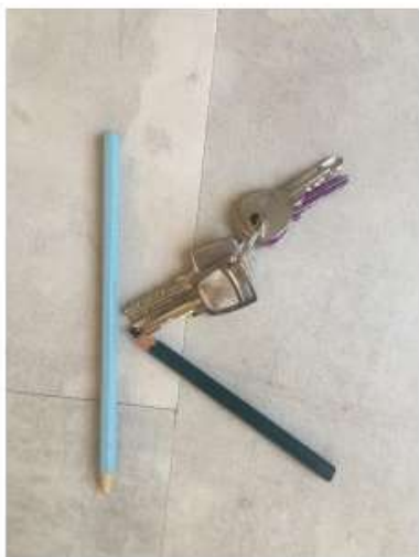
LE K DE KATIA