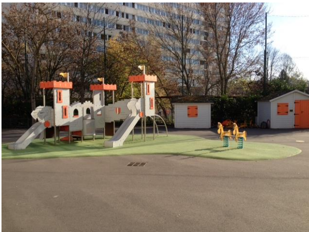
La cour de récréation