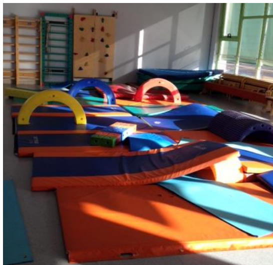
Le préau – salle de sport