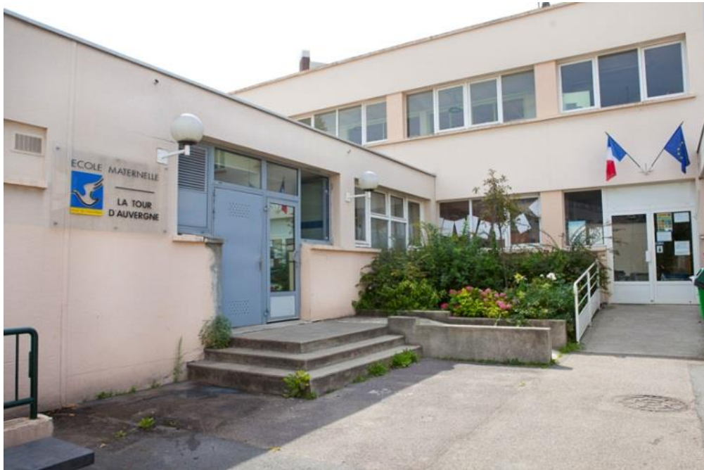
L'entrée de l'école