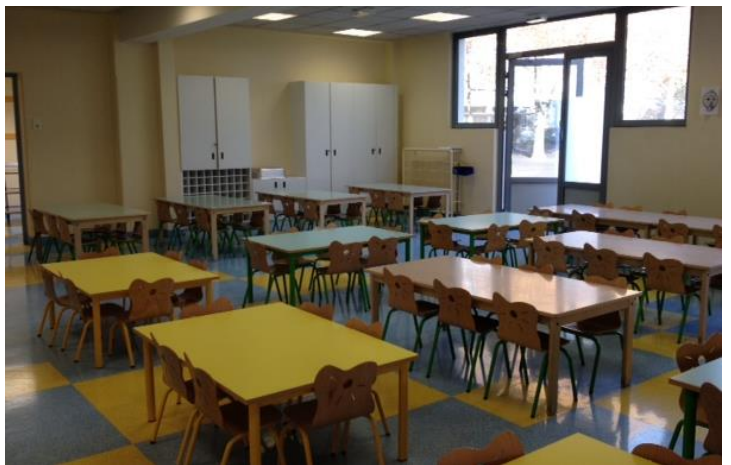
La salle de restauration