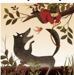
Pierre et le loup

ECOUTER UN CONTE MUSICAL https://www.youtube.com/watch?v=eN4lyb8HKjM