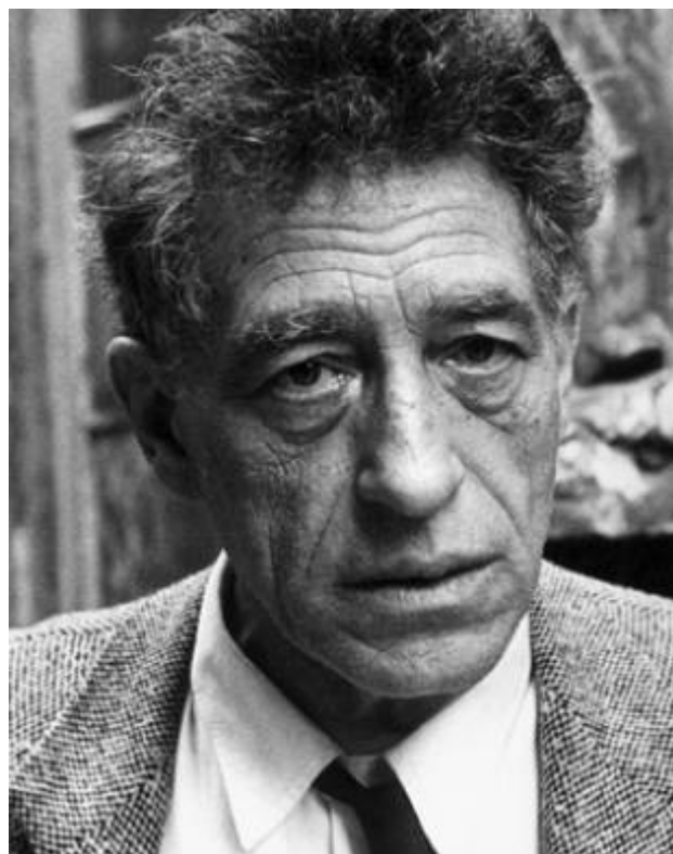
Alberto Giacometti (1901-1966)