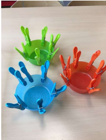
Les pinces à linge autour d'un bol