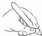
Posture normale : enfant gaucher

Jeux de constructions que vous avez à la maison