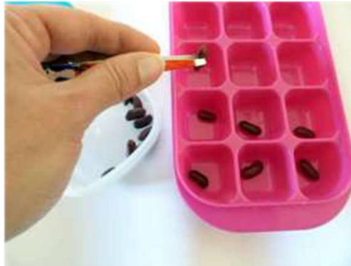
Les haricots à la pince à épiler