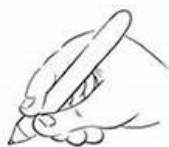
Posture normale : enfant droitier