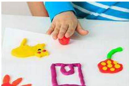
La pâte à modeler (il existe des recettes de pâte à modeler maison ou de pâte à sel)